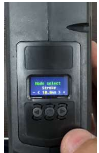
設定画面(本体上部)